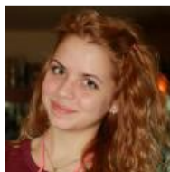
Одноклассницы задушили 14-летнюю девочку