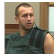
Отец заснул дочь в морозилку