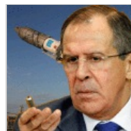
Лавров: Россия поставила на колени весь мир!