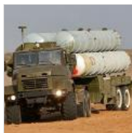
Почему мир не намерен терпеть российские ракеты С-300 в Сирии?