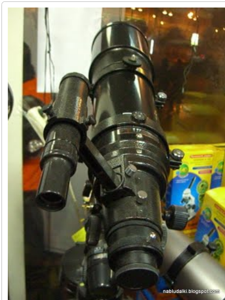
Телескоп Orion Astro View 1200 EQ.

Стоит такая прелесть в "4 глаза" 38 280 руб. Причём это бюджетный вариант. Мощные телескопы стоят от 100 тысяч рубчиков.