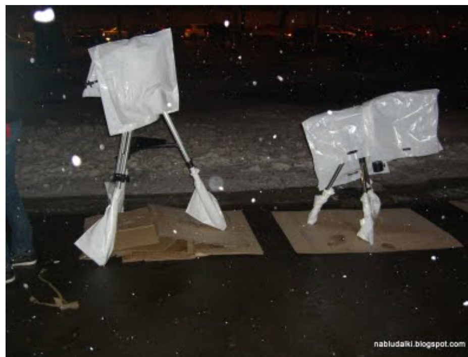
Вынесенные под открытое небо телескопы в чехлах.

Немногим оптимистам и энтузиастам, которые несмотря ни на что всё же пришли на мероприятие, визуально удалось заглянуть только в микромир, но никак не в макро: всем желающим магазин предоставил 4 микроскопа с препаратами животного и растительного происхождения. Это, конечно, тоже было интересно, лично я в последний раз смотрела в микроскоп ещё в школе. В телескопы же так и не удалось посмотреть ни на Луну, ни на звёзды.